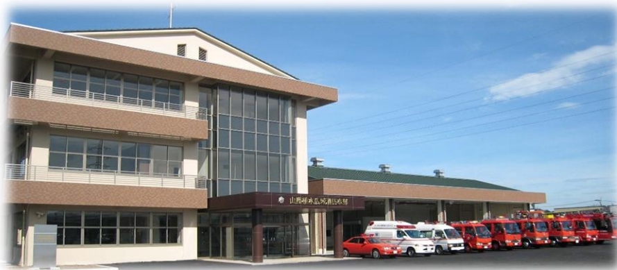
山鹿植木広域行政事務組合消防本部(平成19年8月～平成27年3月) 山鹿市消防本部(平成27年4月～)