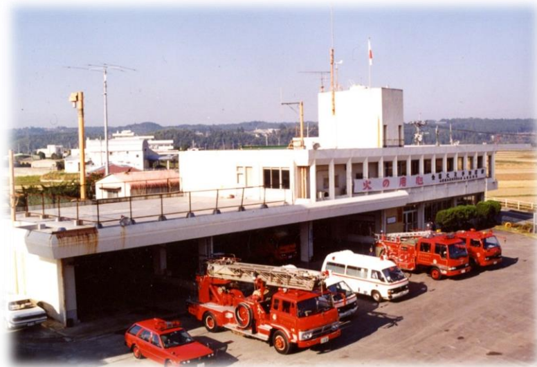
旧山鹿植木広域行政事務組合消防本部(～平成19年7月)