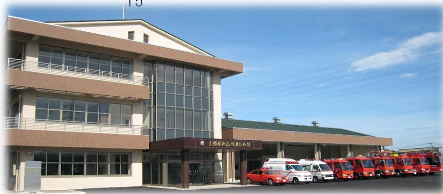
山鹿植木広域行政事務組合消防本部(平成19年8月～平成27年3月) 山鹿市消防本部(平成27年4月～)