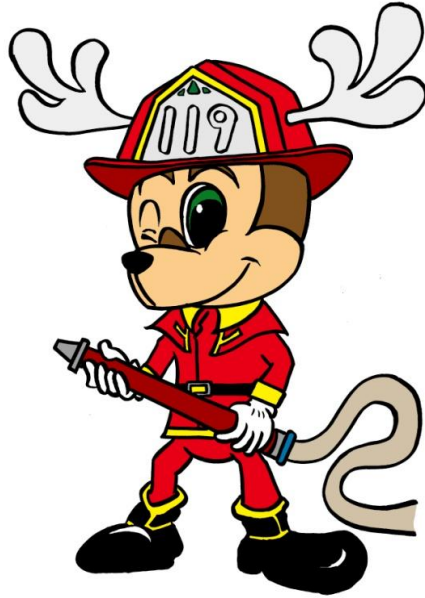
《公式キャラクター》 番火(バンビ)