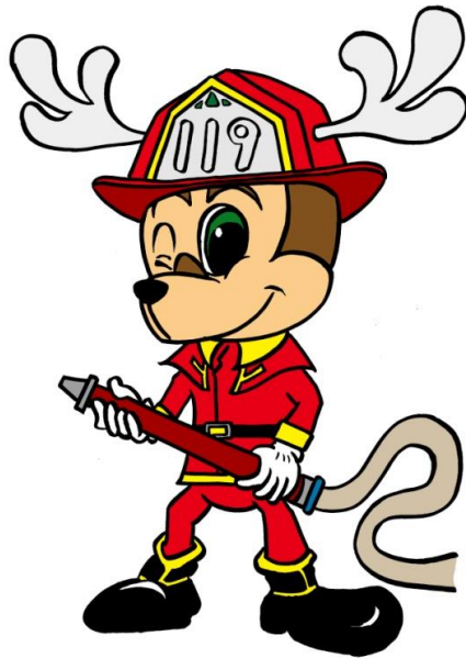
《公式キャラクター》 番火(バンビ)